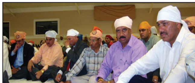
ਫਰੀਮਾਂਟ (ਡੀ. ਡੀ. ਬੀ.) ਬੀਤੇ ਐਤਵਾਰ ਸ੍ਰੀ ਗੁਰੂ ਰਵਿਦਾਸ ਸਭਾ ਬੇ-ਏਰੀਆ (ਕੈਲੀਫੋਰਨੀਆ) ਦੀ ਨਵੀਂ